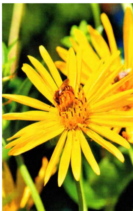
Le Silphion perfolié