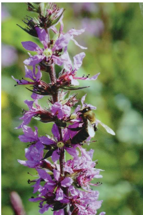
La Vipérine

La vipérine commune est étudiée dans le dernier (Abeilles et Fleurs) . Tandis que le Silphion perfolié de la famille des asters est à l'honneur dans (L'Abeille de France)